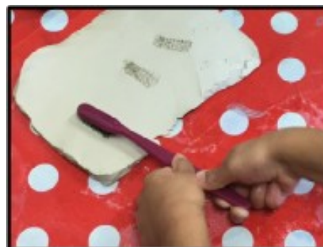
Réaliser des empreintes dans de l'argile

Projet EMA Devosge, Dijon * Classe de PS/MS/GS, S.DAO *CDRS 2019/20